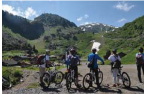
Portes du soleil