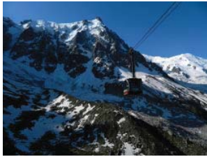
La funivia dell'Aiguille du Midi

► News ► Le sfide della mobilità sostenibile, dalle città alle Alpi. Di Simonetta Radice