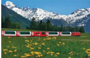
Glacier Express