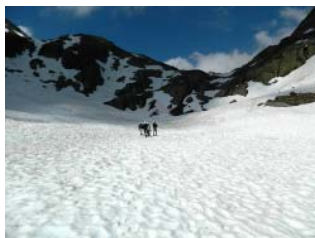
Gran San Bernardo