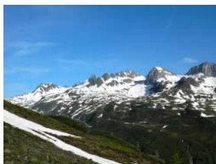
Verso il Passo di San Giacomo