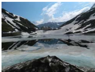
Ospizio del Gran San Bernardo