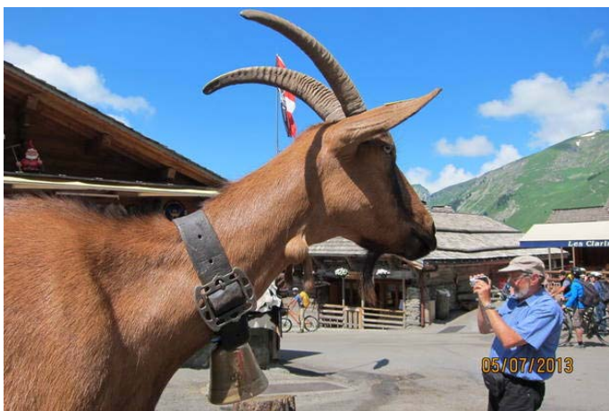
Najboljša piarovka za sir iz lastnega mleka.