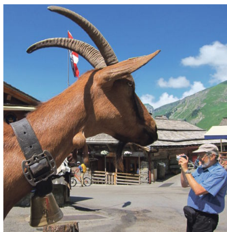
Koze v vasi Les Lindarets so odlične piarovke vaškega sirarja.

Navsezgodaj smo se po zelenih pobočjih povzpeli proti prelazu San Giacomo in mehko vstopili v Piemont. V vasi Ponte živi še peščica prebivalcev, ki govorijo walsersko nemščino, nareče, ki so ga pred mnogo stoletji govorili na velikem