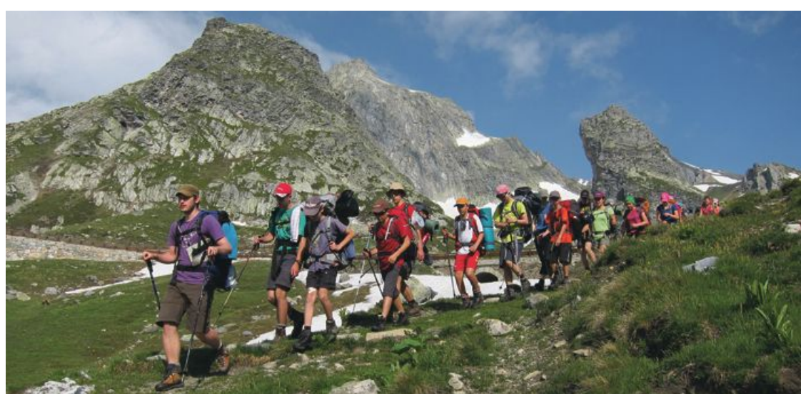
Najbolj trajnosten – in najlepši – način potovanja po Alpah

V Gran Paradisu živi okoli 3500 alpskih kozorogov, vendar se njihovo število zmanjšuje zaradi pospešenega taljenja ledenikov. Kljub