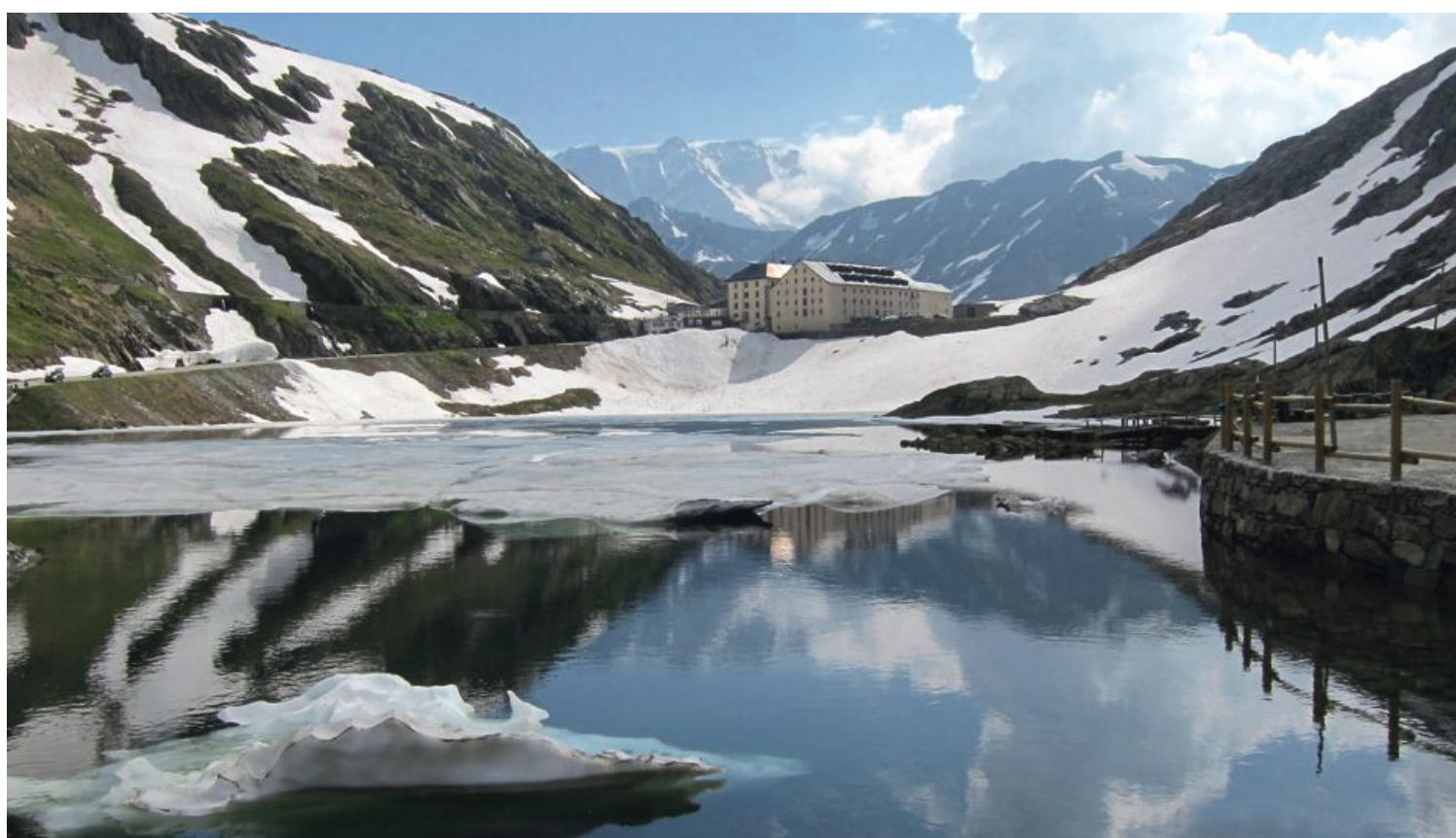
Veliki Sveti Bernard je najstarejši cestni prehod v zahodnih Alpah.

Mimo pisanih alpskih travnikov smo se spustili do jezera Montriond, kjer so nam postregli z glavno jedjo, ki bi ugonobila še Obeliksa. Ta je že nakazala usmeritev tokratnega SuperAlp!, zaradi česar smo ga preimenovali v holesterolsko turnejo. Čežmerno obteženi smo zamenjali dva avtobusa in vlak ter prispeli do Chamonixa, ki je bil natrpan z večino angleškimi turisti. Mondeno smučarsko središče s turizmom diha vse dni v letu, letos si obeta okoli tri milijone turistov. Cene so nore, vendar imajo prilek v dolini privilegij brezplačnega prevoza z avtobusi in vlaki. Prevoz z gondolo do vrha Aiguille du Midi